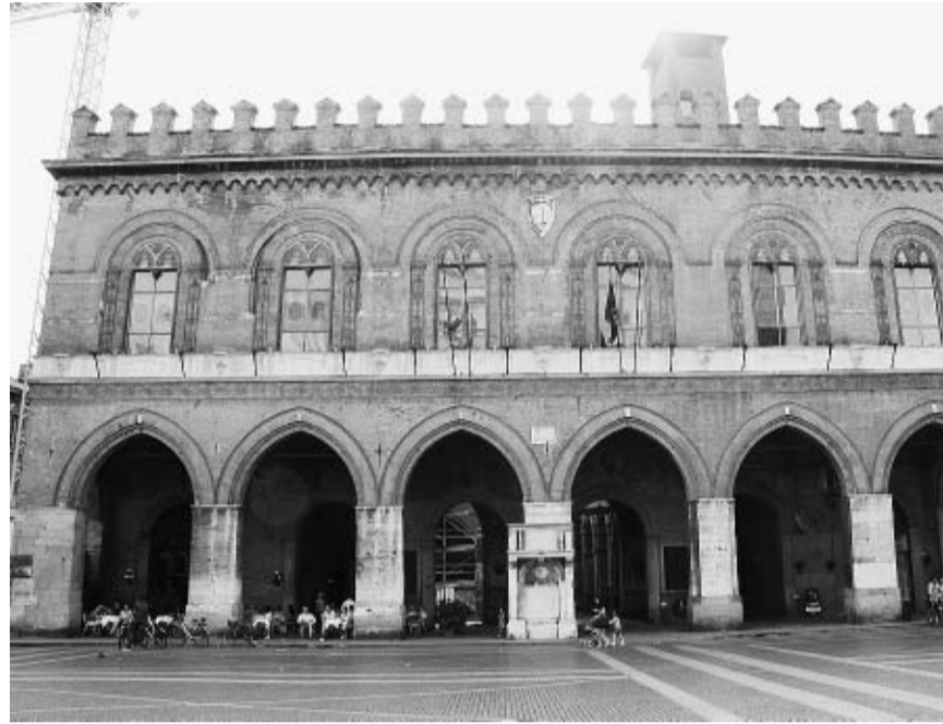
Il palazzo del Comune di Cremona